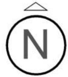
Схема розташування території у планувальній системі населеного пункту (існ. стан) М 1:5000